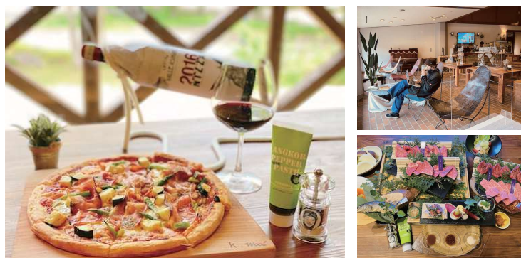
地元の素材を味わえるメニューに舌鼓。

今年で開園50周年を迎えるひろしま県民の森、笑顔変わらず装い新たに再スタートです。